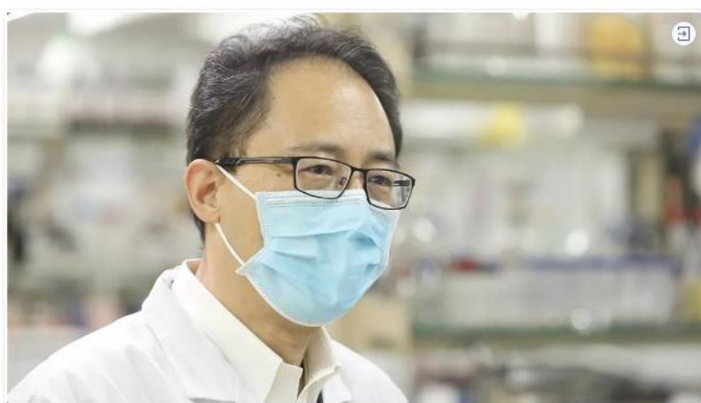
只需三步！陈建峰院士团队教你如何重复使用口罩

实验室主任、中国工程院院士陈建峰承担科技部重点研发计划“公共安全风险防控与应急技术装备”重点专项“可重复使用防护口罩关键技术及产业化”，得到中央领导同志的两次批示并充分肯定。卢咏来教授承担北京市科技计划新型冠状病毒感染专项“可复用高阻隔防护用品用熔喷级聚丙烯制备技术及产业化研究”。有关成果受到 14 个国家工程院专家代表的认可。